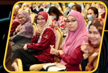
Bersama Staf Akademik