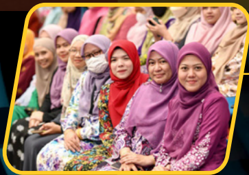
Bersama Staf Pentadbiran

KDYMM Sultanah Nur Zahirah Sultanah Terengganu Canselor UnisZA