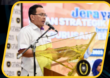
Perkongsian PSU oleh Naib Canselor UnisZA